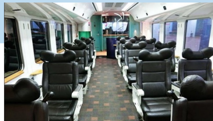
九州 883 系觀光列車